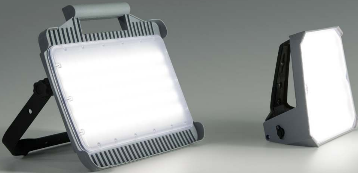
LED Arbeitsleuchte MATE 3220