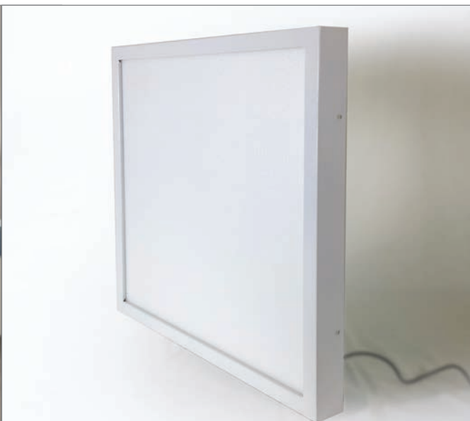
Aufbaurahmen (Aufbaumaß 58mm)