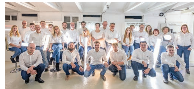
Das Wir sind Heller-Team