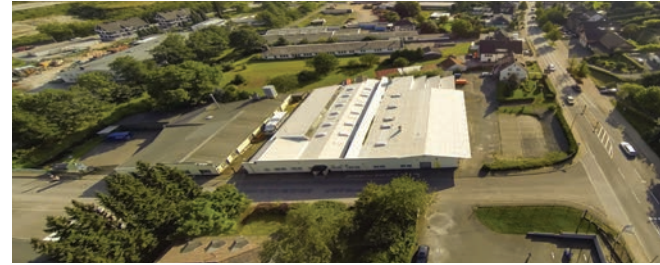
WSH GmbH in Bergneustadt